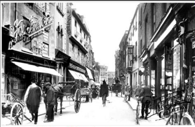
Cambridge, Petty Cury 1909 Ref: 61469