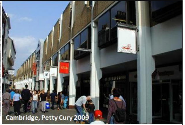
Cambridge, Petty Cury 2009

Hace un siglo, había unas tiendas en esta calle.