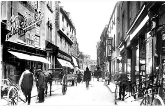
Cambridge, Petty Cury 1909 Ref: 61469