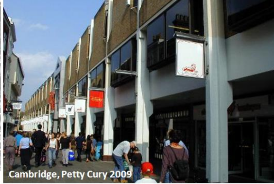
Cambridge, Petty Cury 2009