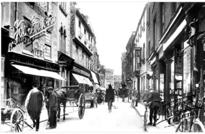
Cambridge, Petty Cury 1909 Ref: 61469