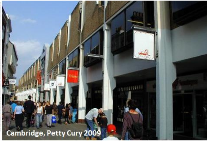
Cambridge, Petty Cury 2009