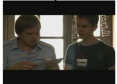
ein Gespräch bekommen