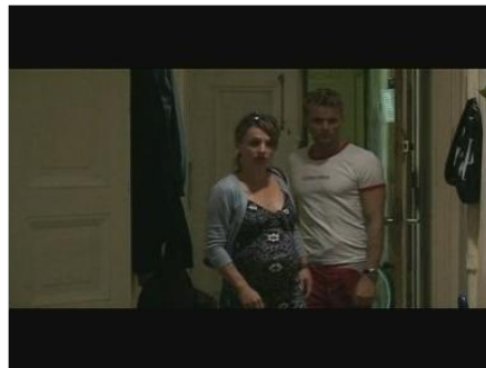
zu seiner Mutter nach Hause gehen